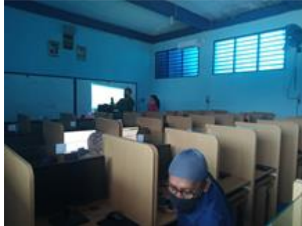
Gambar 1 Salah satu anggota tim pelaksana sedang menyiapkan infocus untuk sarana presentasi

Berikut adalah foto-foto pada saat pelaksanaan kegiatan Pengabdian Kepada Masyarakat: