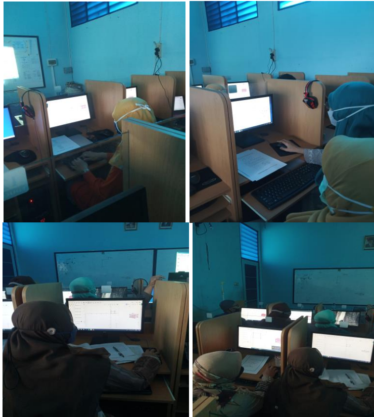
Gambar 3 Peserta sedang mengikuti kegiatan pelatihan dengan serius dan antusiasme yang tinggi

Dari gambar 3 terlihat keseriusan dan antusiasme para peserta dalam mengikuti kegiatan ini, dan walaupun kegiatan ini dilaksanakan secara tatap muka langsung tetapi kami tetap berusaha menjalankan dan menjaga protokol kesehatan sesuai anjuran pemerintah dan Satgas covid-19.