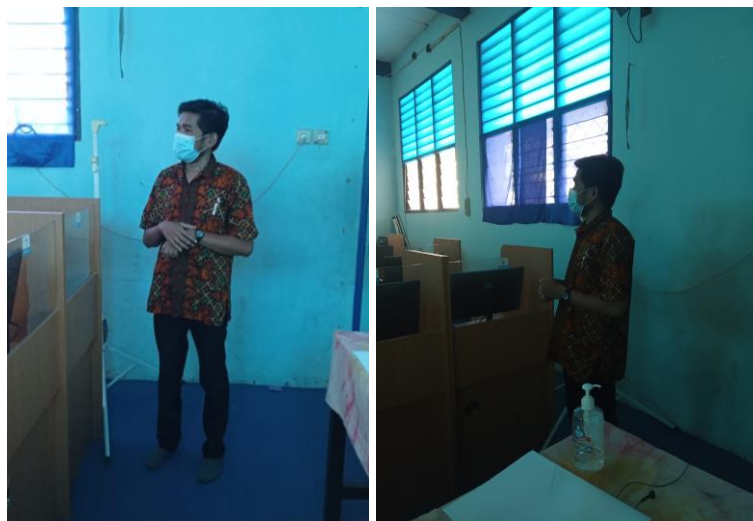
Gambar 2 Sambutan dari perwakilan Kepala Sekolah SMP PRISMA DEPOK

Dari gambar 1 terlihat, persiapan kegiatan yang diawali oleh pemasangan infocus oleh anggota tim dan staff dari pihak Sekolah. Setelah persiapan kegiatan dilakukan baik pemasangan infocus dan menginstall software ke komputer peserta, kemudian baru kegiatan PKM dimulai.