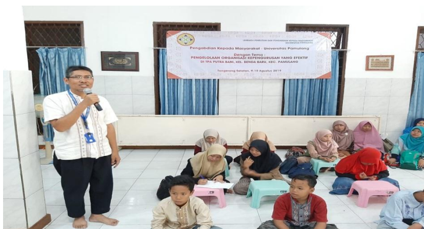
Gambar 3 Acara Penyuluhan