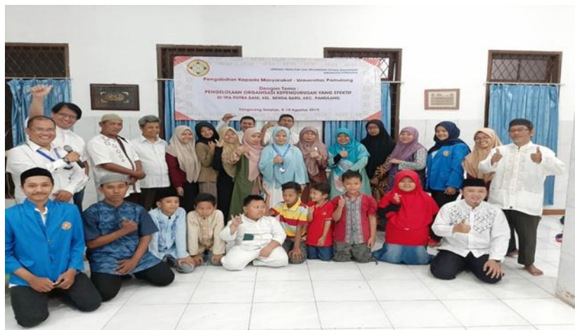
Gambar 4 Berfoto dengan siswa, orang tua, pengajar, dan pengurus TPA Putra Bani