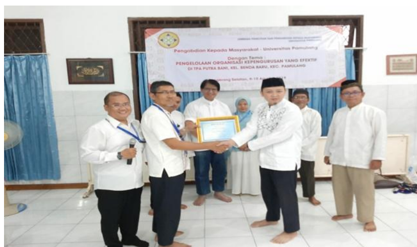
Gambar 5 Penyerahan Cendera Mata