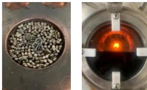
Gambar 1. Material dasar sebelum proses (a) dan saat proses peleburan

Proses peleburan material dilakukan setelah material titanium, molibdenum dan niobium dilakukan proses penimbangan terlebih dahulu sesuai perhitungan material balance. Sintesis dilakukan melalui proses peleburan menggunakan mesin Electric Vacuum Arc Furnace merk Elatec Technology Corporation . Desain material paduan berbasis Ti-Mo-Nb ini yaitu 88% titanium, 5% molibdenum dan 9% niobium dengan target material balance seberat 20gram sehingga berat titanium = 17,2 gram (86%), molibdenum = 1,0 gram (5%) dan niobium 1,8gram (9%). Pada Gambar 1. menunjukkan material sebelum dilakukan peleburan, saat sintesis melalui proses peleburan.