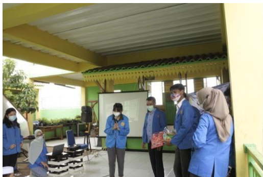
Gambar 2 Sesi Tanya J Jawab