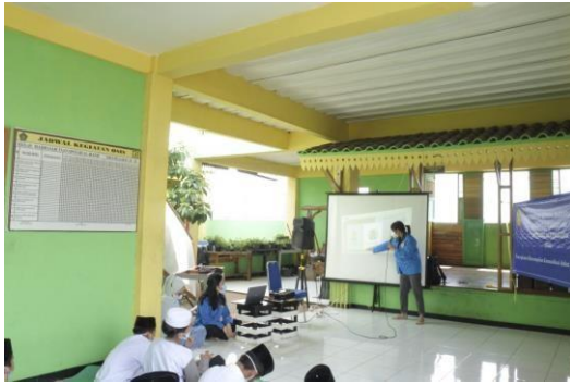
Gambar 1 Penyampaian Materi

Pengabdian Kepada Masyarakat adalah suatu kegiatan yang bertujuan membantu masyarakat tertentu dalam beberapa aktivitas tanpa mengharapkan imbalan dalam bentuk apapun. Secara umum program ini dirancang oleh berbagai universitas yang ada Indonesia untuk memberikan kontribusi nyata bagi bangsa Indonesia, khususnya dalam mengembangkan kesejahteraan dan kemajuan bangsa Indonesia.