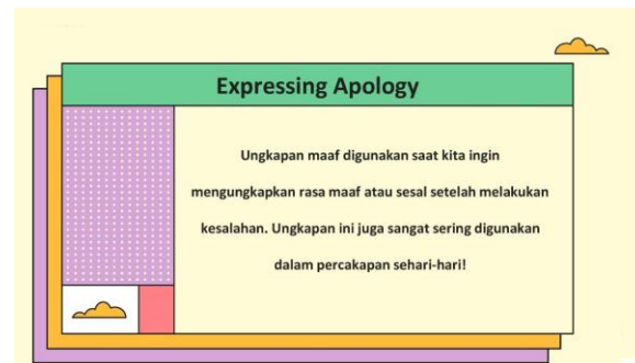
Gambar 3 Materi 1

Pembahasan dan hasil dari Peningkatan Keterampilan Komunikasi dalam Bahasa Inggris di Yayasan Al-Hanif Pamulang adalah dengan penyampaian materi komunikasi dasar Bahasa Inggris dan juga praktek komunikasi dasar Bahasa Inggris. Adapun materi yang disampaikan adalah sebagai berikut: