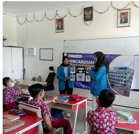
Gambar 2. Pemaparan Materi dengan Lapbook

pengabdian. Adapun kegiatan yang dilakukan pada saat kegiatan pengabdian;