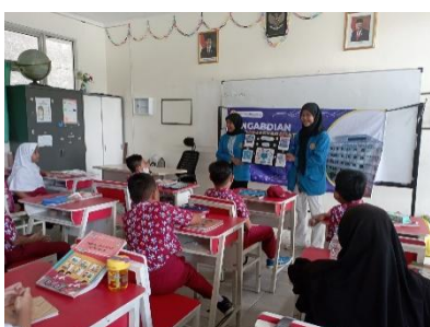
(Gambar 3. Kegiatan Pemaparan Materi)