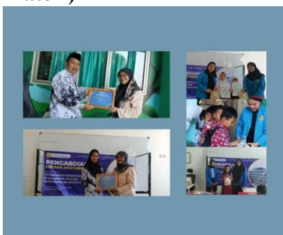
(Gambar 4. Pemberian Cindera Mata dan Ucapan Terimakasih)