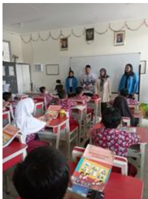
(Gambar 2. Sambutan Kepala Sekolah dan Dosen Pembimbing)