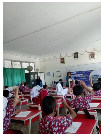
(Gambar 1. Pembukaan Kegiatan P(M)KM oleh Ketua Pelaksana)

Penulis dan tim pengabdian masyarakat dari Program Studi Akuntansi, Program Sarjana, Universitas Pamulang mengucapkan terima kasih kepada Kepala Sekolah, Wakil Kepala Sekola, Guru, dan seluruh murid kelas 2A SDN Pamulang 02 yang sudah memberikan kesempatan kepada tim pengabdian masyarakat untuk memberikan sosialisasi pemanfaatan digital dikalangan pelajar.