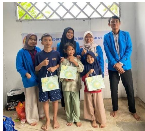
(Gambar 3. Foto pada saat serah terima cinderamata)