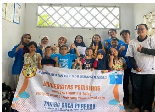
(Gambar 2. Foto Bersama Tim PKM dengan Peserta PkM)

Puji syukur kita panjatkan kepada Tuhan Yang Maha Esa, atas berjalannya kegiatan pengabdian. Tidak lupa juga kita ucapkan banyak terimakasih kepada pengurus dari Taman Baca Parakan, anak-anak yang telah hadir dan aktif mengikuti kegiatan pengabdian. Serta kepada Dosen pembimbing kita kami ucapkan banyak terimakasih karena telah membantu kita dari awal sampai akhir tugas pengabdian ini selesai.