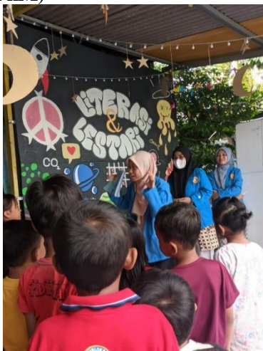
(Gambar 2. Foto pada saat pemberian materi)