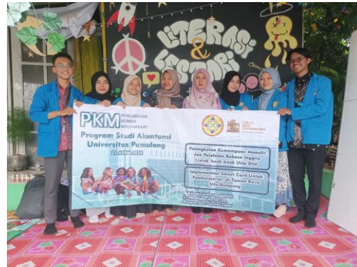
(Gambar 4. Foto Tim PKM bersama Dosen Pembimbing beserta Ketua Divisi Taman Baca Situ Rompng)