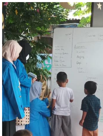
(Gambar 3. Foto pada saat bermain games)