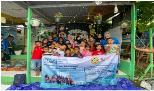
(Gambar 1. Foto Bersama Tim PkM dengan Peserta PkM)