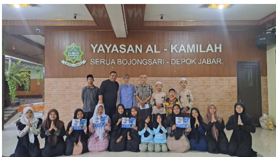
(Gambar 4. Foto Serah Terima Brosur Unpam)