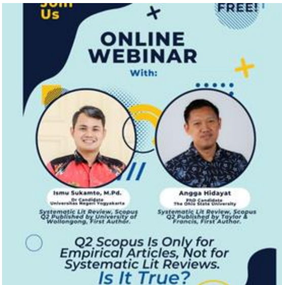
(Gambar 2. Foto Flyer Webinar PkM)