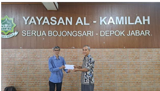
(Gambar 3. Foto Serah Terima Dana Fundraising)