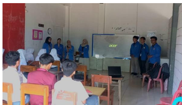
(Gambar 2. Foto pada saat Sambutan ketua pelaksanaan PkM)