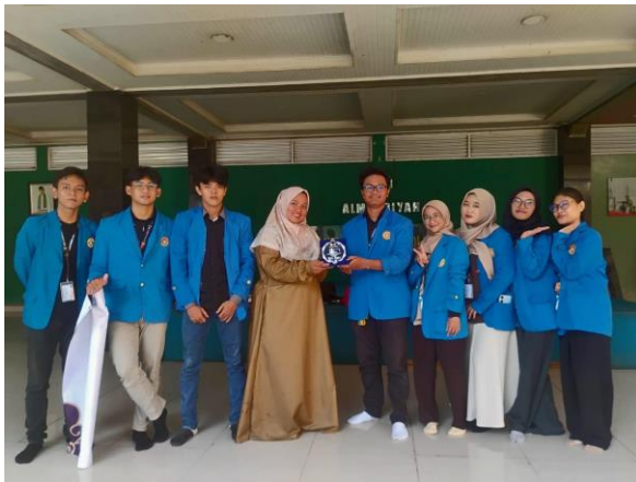
(Gambar 4. Foto pada saat serah terima cinderamata/ungkapan terima kasih)