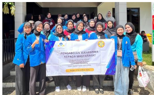
Gambar 2. Foto Bersama Tim PkM dengan Peserta PkM

sehingga kegiatan ini dapat terlaksana dengan baik.