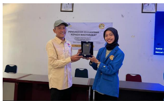
Gambar 4. Foto pada saat Penyerahan Plakat Ketua PkM