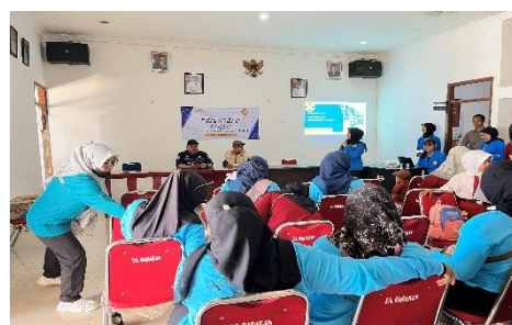
Gambar 3. Pembukaan dan Penyampaian Materi