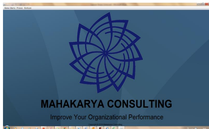
Gambar 3. Tampilan Menu Utama