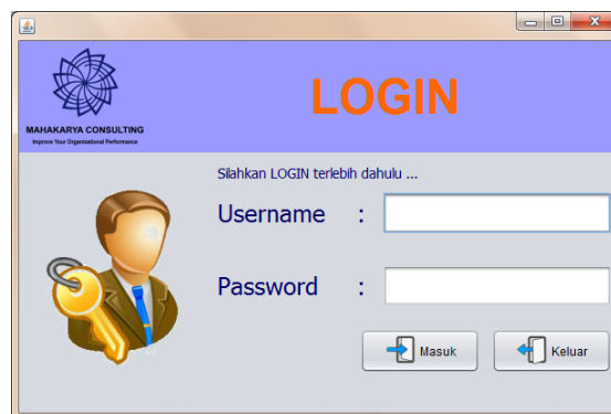
Gambar 2. Tampilan Form Login