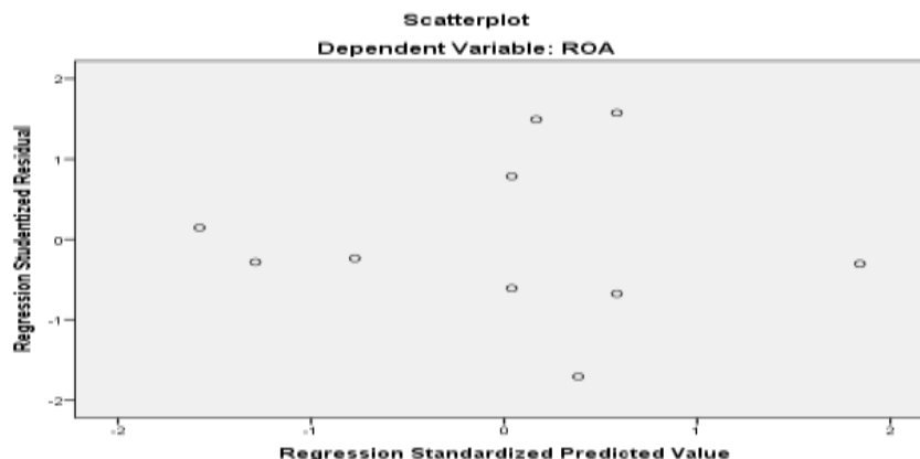
Gambar 3 Scaterplot

Uji Heteroskedastisitas “biasa digunakan untuk menguji apakah dalam model regresi ini terjadi ketidaksamaan variance dari residual suatu pengamatan kepengamatan yang lainnya. Model regresi ini yang baik adalah yang merupakan homokedastisitas atau tidak terjadi heteroskedastisitas”.