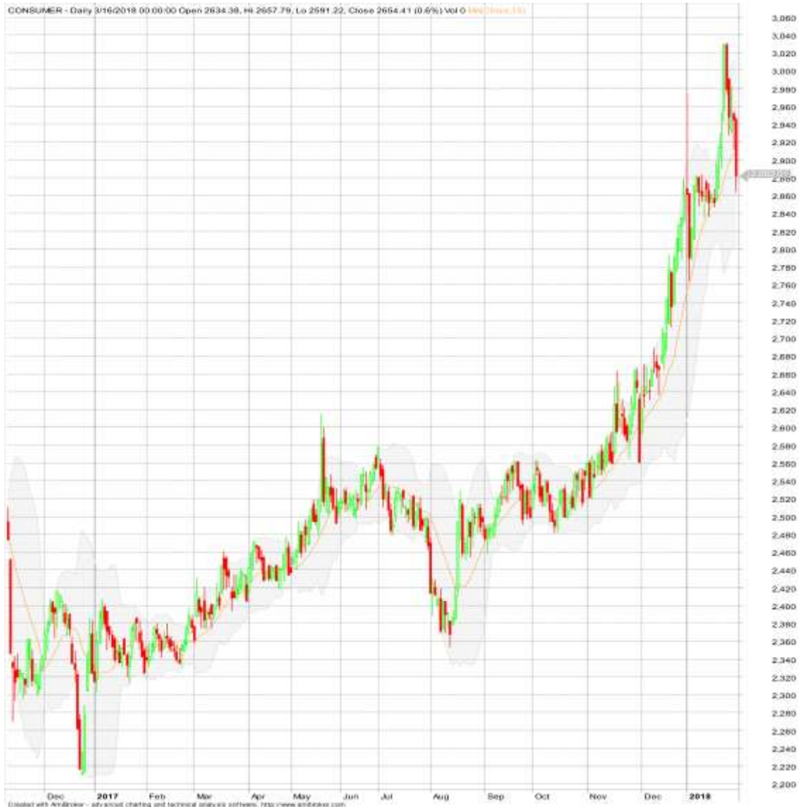
Gambar 2. Pergerakan Harga Saham Index Consumer Goods Selama tahun 2107

Model 1 dalam penelitian disajikan sebagai berikut :