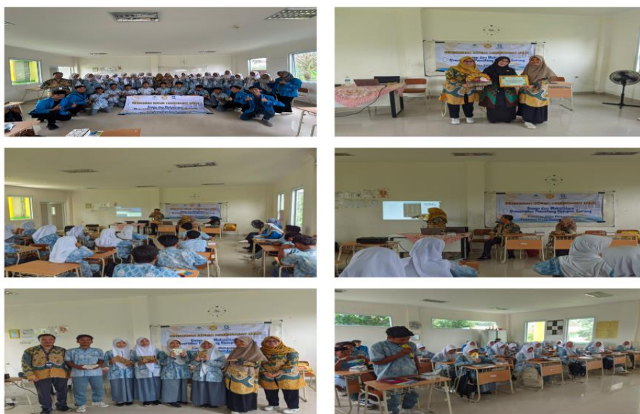
Gambar 4. Kegiatan Pelaksanaan PkM