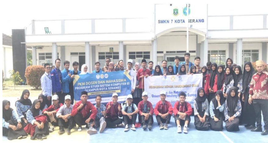
Gambar 2. Kegiatan PkM

Umpan Balik untuk Pengembangan Program Peserta menyarankan agar pelatihan diadakan secara bertahap, dengan pembahasan yang lebih mendalam pada tema tertentu, seperti desain responsif atau optimasi SEO. Guru berharap pelatihan serupa dapat dilakukan secara rutin untuk meningkatkan kompetensi siswa secara berkelanjutan. Peserta menyarankan agar pelatihan diadakan secara bertahap, dengan pembahasan yang lebih mendalam pada tema tertentu, seperti desain responsif atau optimasi SEO.