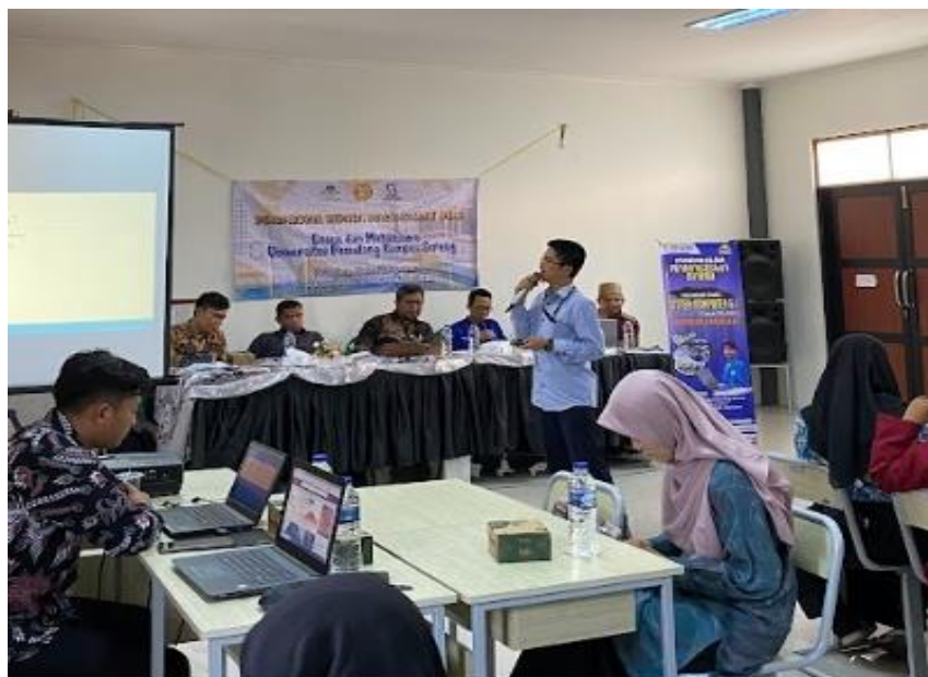
Gambar 1. Pemaparan Materi Wordpress

Pelatihan WordPress ini memberikan dampak positif dalam pengembangan keterampilan digital siswa SMKN 7 Kota Serang. Beberapa poin penting yang menjadi fokus dalam pembahasan hasil adalah: