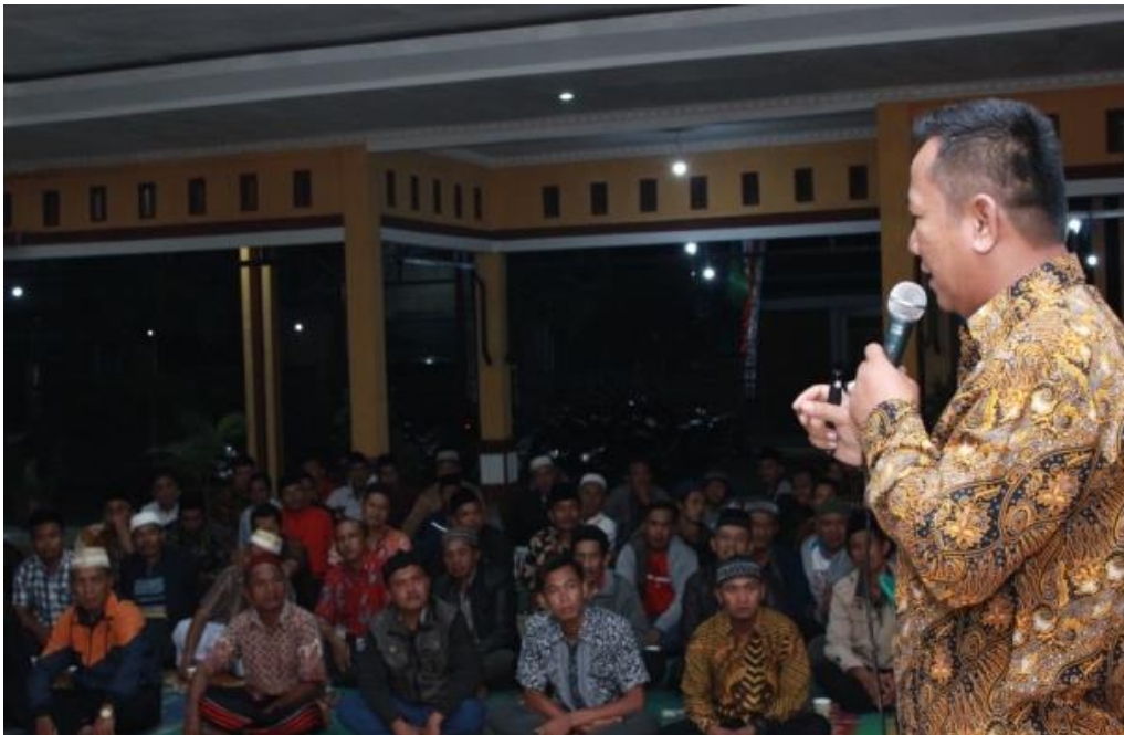
Gambar 5. Ketua Tim PkM PPDM Universitas Baturaja menyampaikan sosialisasi program PPDM

Acara diawali dengan laporan Ketua Tim PkM PPDM Universitas Baturaja, sambutan Kepala Desa dan Sambutan Camat Banding Agung yang hadir sekaligus membuka acara atas nama Bupati Ogan Komering Ulu Selatan. Ketua Tim PkM PPDM Universitas Baturaja memaparkan tujuan, tahapan dan tujuan yang hendak dicapai oleh kegiatan PkM. Para peserta sosialisasi program sangat antusias merespon materi dan informasi yang disampaikan oleh Tim PkM PPDM Universitas Baturaja. Hal itu terlihat pada sesi diskusi dan tanya jawab, masyarakat secara aktif menyampaikan pertanyaan, pendapat dan masukan terhadap rencana kegiatan program PkM yang akan dilaksanakan oleh Tim PkM PPDM Universitas Baturaja.