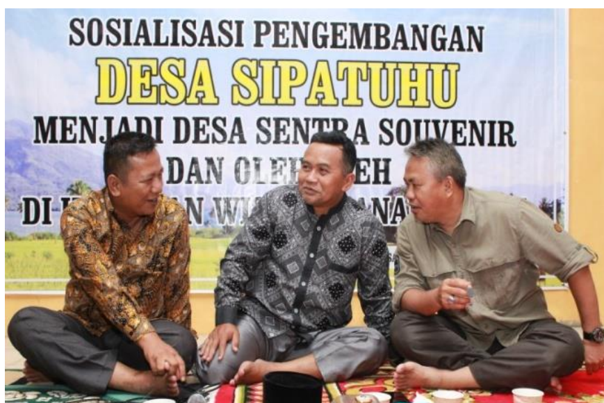
Gambar 4. Tim PkM PPDM dan Kades Sipatuhu

Tahap berikutnya Tim PkM PPDM Universitas Baturaja, dengan melibatkan mahasiswa melakukan survei pemetaan potensi desa serta pemasalahan-permasalahan yang dihadapi oleh Pemerintah Desa dan BUMDes serta para pelaku usaha, terkait dengan produksi usaha guna meningkatkan kesejahteraan masyarakat guna menjadikan Sipatuhu sebagai sentra souvenir dan oleh-oleh di kawasan wisata Danau Ranau. Dari dua tahapan itu, akhirnya pada tanggal 12 Juni 2020 disepakati pelaksanaan sosialisasi program dan pelaksanaan tahapan kegiatan PkM PPDM Universitas Baturaja dengan melibatkan unsur-unsur Pemerintah Desa, Pengurus BUMDes, pelaku usaha, tokoh-tokoh masyarakat di Desa Sipatuhu yang berjumlah 45 orang, di Kantor Kepala Desa Sipatuhu.