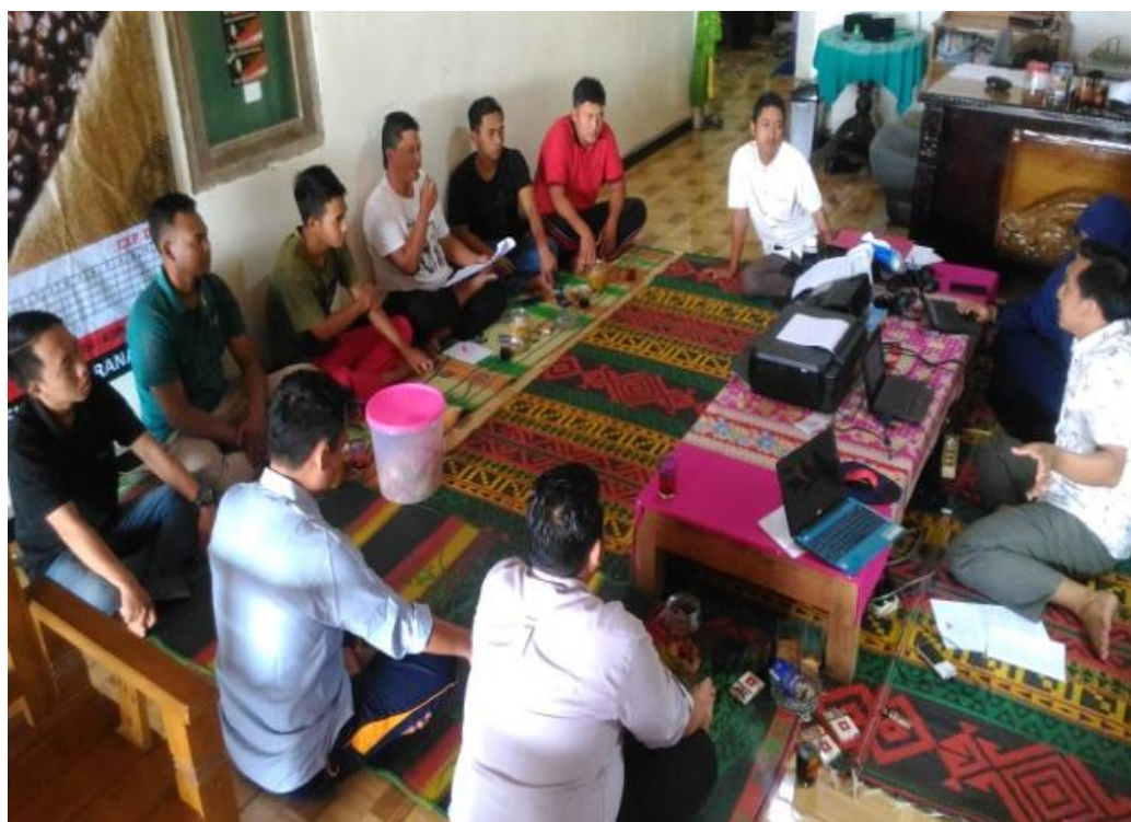
Gambar 6. Diskusi dengan pengurus BUMDes Sipatuhu

menjadikan para pelaku usaha rumah tangga di Desa Sipatuhu sebagai mitra usaha BUMDes.