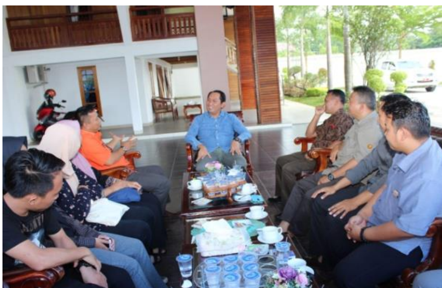
Gambar 3. Koordinasi dengan Bupati dan OPD terkait

Selanjutnya, kegiatan PkM PPDM 2020 ini diawali dengan berkoordinasi dengan Pemerintah Daerah Kabupaten Ogan Komering Ulu Selatan, yaitu dengan Bupati, Dinas Pemberdayaan Masyarakat Desa (PMD) dan Camat Banding Agung. Selanjutnya, dalam kegiatan ini dilaksanakan tahapan sebagai berikut: