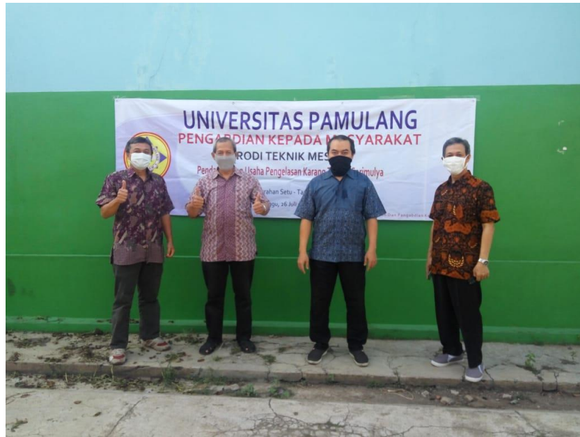
Gambar 2. Tim PKM yang terdiri dari dosen Teknik Mesin berfoto sejenak sebelum acara Pengabdian Kepada Masyarakat dimulai

Setelah penutupan dilakukan acara ramah tamah dengan peserta dan beres-beres alat bahan yang digunakan. Dengan demikian acara kegiatan PKM di Desa Sari Mulya resmi berakhir.