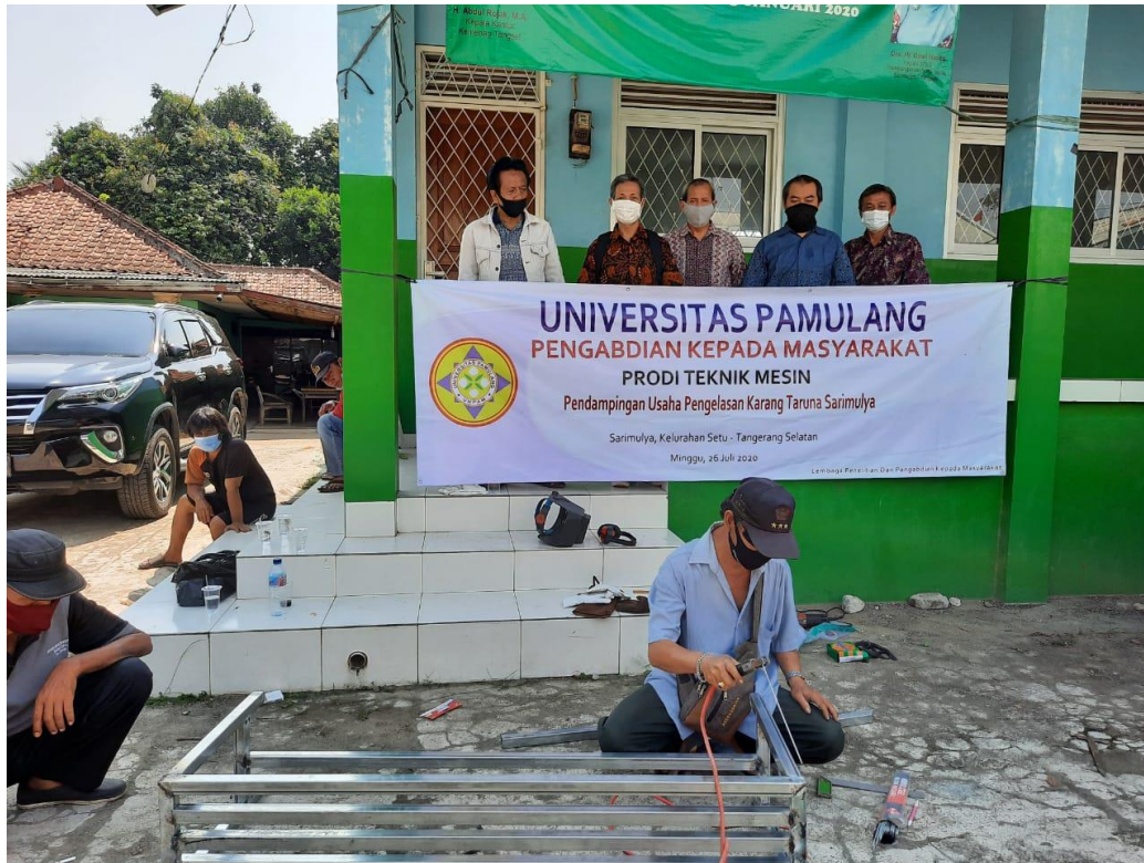
Gambar 7. Tim dosen memperhatikan praktek pengelasan oleh peserta