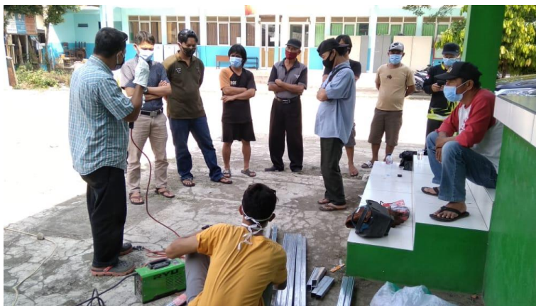
Gambar 5. Para peserta mendengarkan arahan operator pengelasan