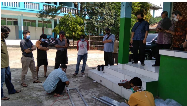
Gambar 6. Para peserta memperhatikan praktek pengelasan oleh operator