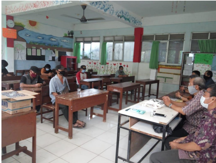
Gambar 4. Para peserta mendengarkan arahan ketua tim PKM