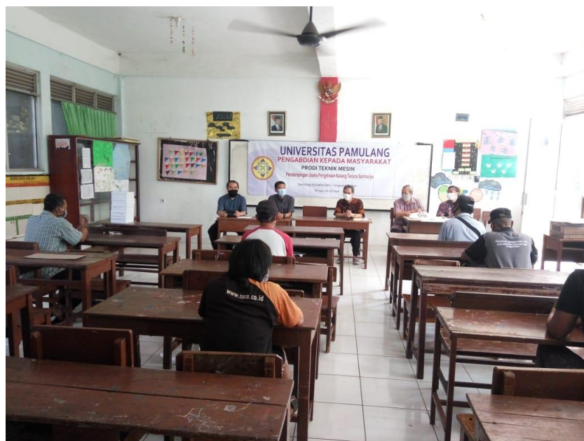
Gambar 3. Ketua tim PKM memberikan pengarahan kepada peserta