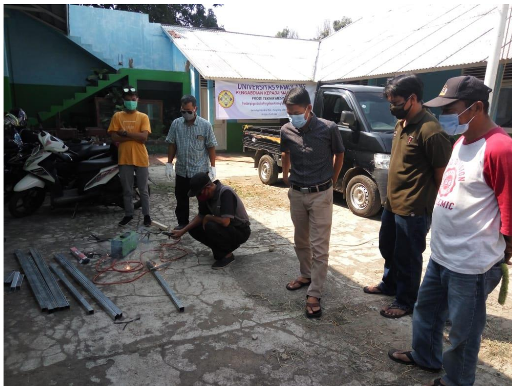
Gambar 8. Para peserta sedang melakukan praktek pengelasan dibimbing oleh operator