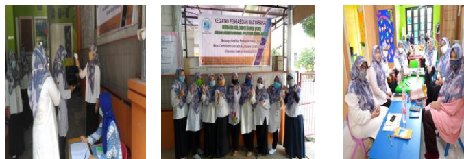
Gambar 2 Foto kegiatan pelaksanaan pelatihan

Berikut gambar yang menjelaskan mengenai pelaksanaan kegiatan pengabdian kepada masyarakat.