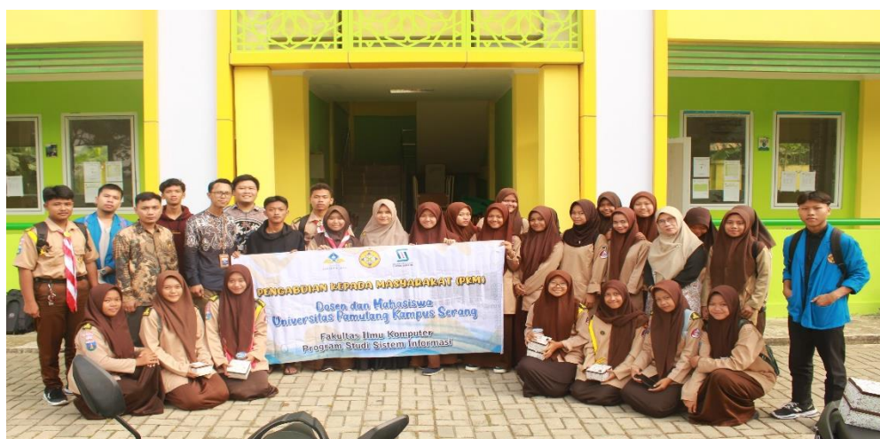
Gambar 2. Foto bersama Panitia PKM dengan murid MAN 2 Kabupaten Serang

Peserta sangat antusias dalam kegiatan pengabdian masyarakat iniseperti yang terlihat dalam gambar 2, peserta didampingi oleh panitia dan mahasiswa dalam mengikuti arahan materi yang disampaikan oleh tutor. Setelah selesai menyampaikan materi dan sesi tanya jawab, peserta diberikan kuisioner untuk diisi sebagai feedback dari kegiatan pengabdian ini. Sesi Foto Bersama dengan Mitra dan Panitia PKM kegiatan pengabdian masyarakat ditutup dengan foto bersama mitra dan panitia pengabdian masyarakat seperti pada gambar 1.