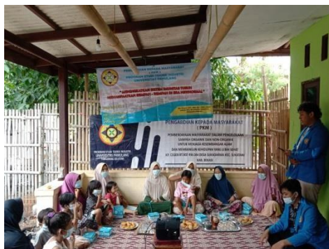
Gambar 1. Proses PKM Mahasiswa

Antioksidan adalah senyawa yang dapat menangkal senyawa-senyawa radikal bebas. (Lestari, 2020)