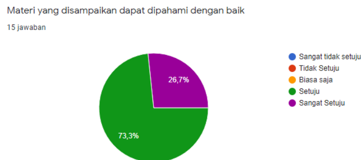
Gambar : Tanggapan instrument kuesioner pertama

Dari data hasil kuesioner tersebut, dapat disimpulkan bahwa sebanyak sekitar 70% peserta PKM dapat memahami materi pembuatan hand soap dengan baik. Data lengkapnya dapat dilihat pada diagram pie berikut :