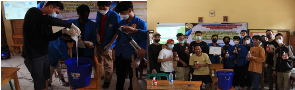
Gambar 2: Pelaksanaan PKM di Desa Pasir Ampo.