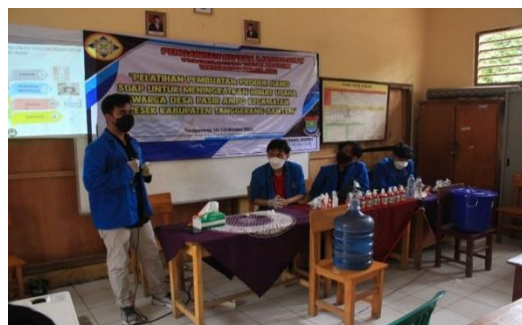
Gambar 1 : Pemberian materi produksi hand soap.

Pemaparan materi tentang pembuatan hand soap dijelaskan oleh kelompok dengan cara bergantian tentang cara membuat hand soap sehingga dapat diaplikasikan oleh karang taruna desa pasir ampo, kecamatan kresek provinsi banten.