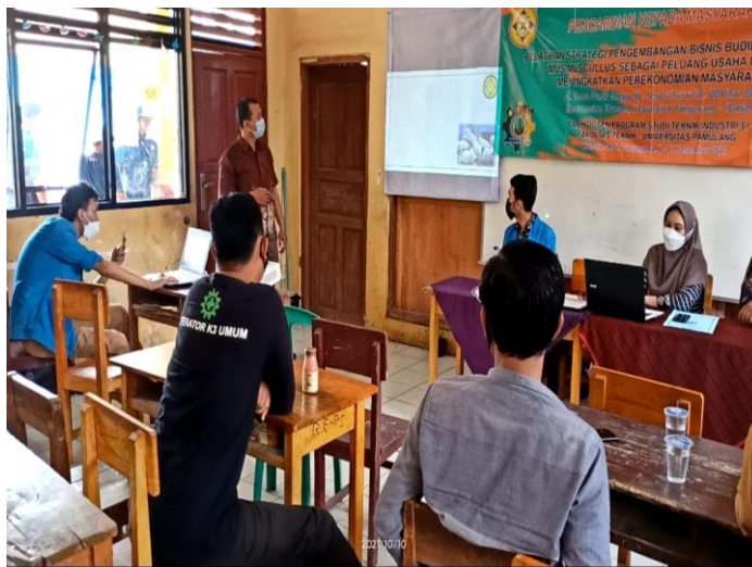
Gambar 1 Pemaparan Materi PKM