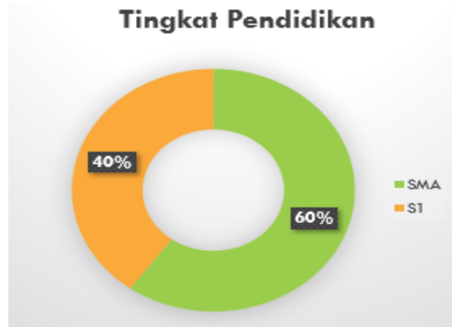
Gambar 6. Persentase Tingkat Pendidikan