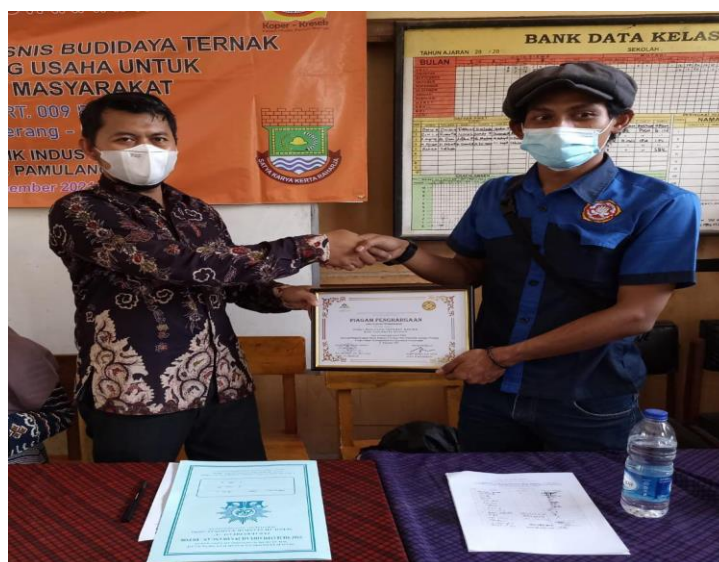
Gambar 2 Pemberian Cenderamata