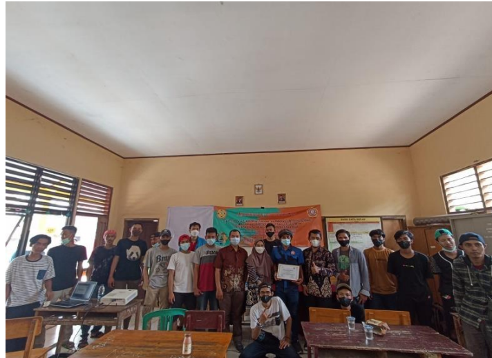
Gambar 3 Dokumentasi Kegiatan

Materi Pelaksanaan Pengabdian Kepada Masyarakat :