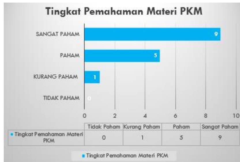
Gambar 7. Tingkat Pemahaman Materi Peserta

Grafik hasil pengabdian kepada masyarakat Desa Koper, Kecamatan Kresek, Kabupaten Tangerang dapat di lihat pada Gambar di Bawah ini :