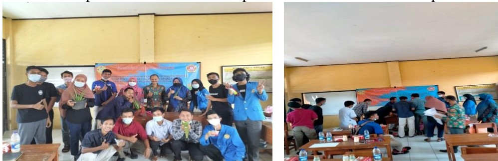
Gambar 1 Foto Kegiatan PKM

Berikut merupakan foto dokumentasi pelaksanaan PKM di desa Koper