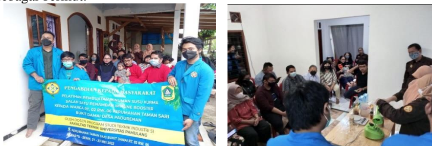
Gambar 1 Foto Kegiatan PKM

Berikut adalah dokumentasi pelaksanaan PKM dengan warga Rt.02/Rw.06 Perumahan Tamansari Bukit Damai Kelurahan Padurenan Kecamatan Gunung Sindur Kabupaten Bogor sebagai berikut: