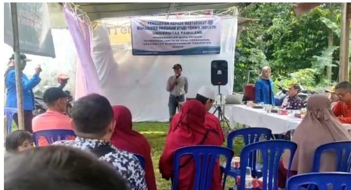
Gambar 3. Sambutan Ketua RW

Sambutan yang kedua diisi oleh Ketua Rukun Tetangga RT02 Kampung Kebon Kopi, kegiatan PKM ini di sambut sangat baik oleh Ketua RW06 Desa Pengasinan dan Ketua RT berharap kegiatan PKM ini dapat memberikan manfaat yang sangat baik kepada warga masyarakat Desa Pangasinan Kecamatan Gunung Sindur Kabupaten Bogor. sambutan kedua berlangsung pukul 09.10-09.30 WIB.