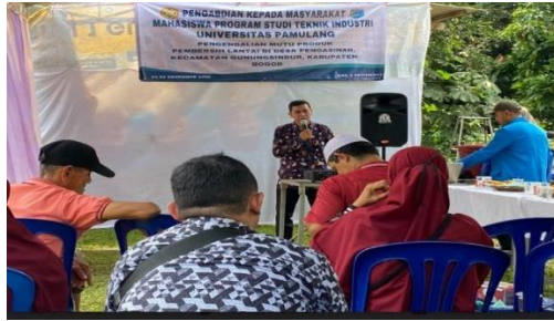
Gambar 4. Sambutan Dosen Pembimbing