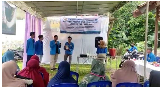
Gambar 4. Sosialisasi Tim PKM Kelompok 2

Pada pelatihan dilakukan penyampaian materi tentang teknik pengemasan pembersih lantai dan menyampaikan materi mencari lokasi yang strategis bagi pelaku usaha. Teknik pengemasan atau packaging salah satu faktor penting. Pada dasarnya, kemasan memang berfungsi sebagai wadah produksi supaya lebih awet. Namun, ternyata semakin berkembangnya zaman, keberadaan kemasan tidak hanya berfungsi demikian tetapi sekaligus sebagai alat promosi. Adapun fungsi umumnya sebagai pelindung produk dari faktor kerusakan, baik itu disebabkan oleh faktor biologi, kimia, maupun fisika. Memudahkan dalam pengiriman dan pendistribusian, memudahkan penyimpanan produk, memudahkan penghitungan, terutama ketika tengah melewati tahap pengemasan jumlah, sarana informasi sekaligus promosi dari produk yang dijual. Hal penting yang bisa memengaruhi sukses atau tidaknya sebuah bisnis.