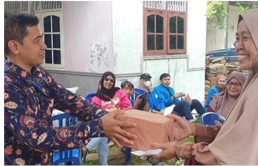
Gambar 7. Foto pemberian hadiahnya jawab