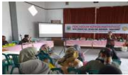
Gambar 2. Pengenalan Bahan Baku Berbasis Green Chemical