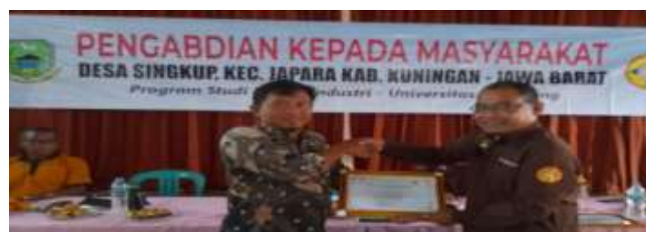
Gambar 1. Serah terima piagam pelaksanaan PKM

Kegiatan pengabdian kepada masyarakat Desa Singkup, Kecamatan Pasawahan, Kabupaten Kuningan, Jawa Barat yang dilaksanakan selama 2 hari dimulai dari tanggal 17 November 2023 sampai dengan tanggal 19 November 2023. Kegiatan dimulai dari sambutan ketua pelaksana pengabdian kepada masyarakat, lalu sambutan dari bapak kepala desa singkup serta pejabat terkait, peserta dari kegiatan pengabdian kepada masyarakat ini ini adalah ibu-ibu PKK dan pemuda karang taruna serta dibantu oleh mahasiswa dari program studi teknik industri Universitas Pamulang.