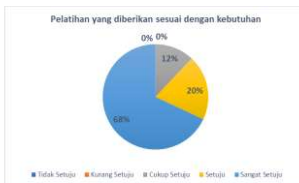
Gambar 5 Tanggapan Kuesioner Kedua

Kemudian untuk instrument kuesioner kedua itu kesesuaian materi pelatihan dengan kebutuhan peserta, ada sekitar 68% peserta menjawab sangat setuju, 20% setuju dan 12% cukup setuju bahwa pelatihan yang diberikan sesuai dengan kebutuhan peserta PKM. Data lengkapnya bisa dilihat pada pie diagram berikut ini: