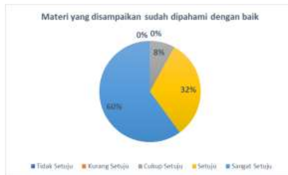
Gambar 4. Tanggapan Instrumen Kuesioner Pertama

Dari data tanggapan peserta PKM pada table 1 diatas bisa disimpulkan bahwa dari keseluruhan peserta yang memberikan tanggapan, ada sekitar 60% menjawab sangat setuju, 32% menjawab setuju dan 8% menjawab cukup setuju bahwa materi yang disampaikan sudah dipahami dengan baik oleh peserta pengabdian kepada Masyarakat. Data lengkapnya bisa dilihat pada pie diagram berikut ini: