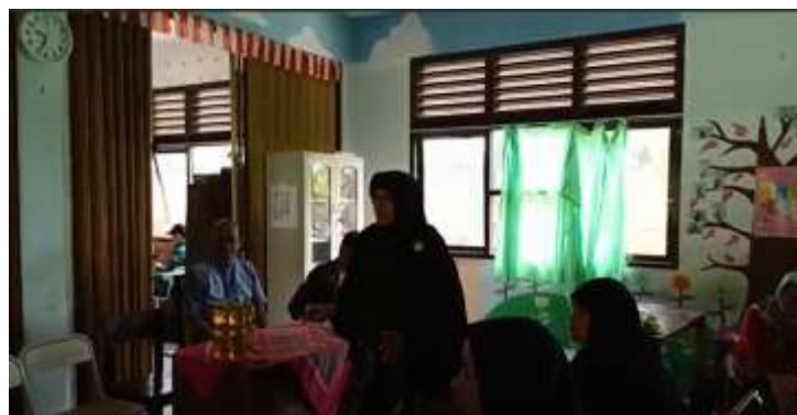
Gambar 4. Pemberian materi