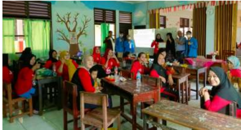
Gambar 5. Penyerahan Piagam