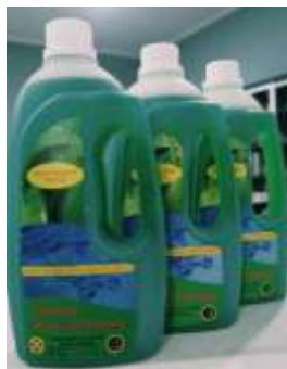
Gambar 1. Produk Sabun Cuci Piring Program Studi Teknik Industri

produk sabun cuci yang dihasilkan oleh Prodi Teknik Industri Universitas Pamulang untuk diajarkan pada masyarakat di Desa Cihuni.