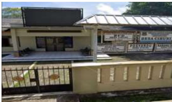
Gambar 2. Kantor Kepala Desa Cihuni

Pagedangan. Kantor kepala desa berada di alamat Jalan Raya Cihuni No. 1, Kelurahan Cihuni, Kecamatan Pagedangan, Kabupaten Tangerang.