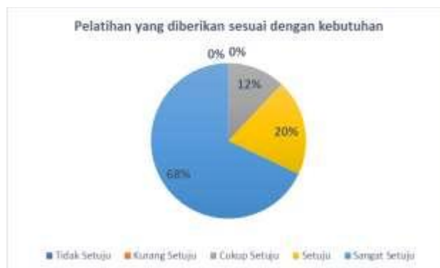
(Sumber: Hasil Pengolahan Data) Gambar 5 Tanggapan Kuesioner Kedua

Kemudian untuk instrument kuesioner kedua itu kesesuaian materi pelatihan dengan kebutuhan peserta, ada sekitar 68% peserta menjawab sangat setuju, 20% setuju dan 12% cukup setuju bahwa pelatihan yang diberikan sesuai dengan kebutuhan peserta PKM. Data lengkapnya bisa dilihat pada pie diagram berikut ini: