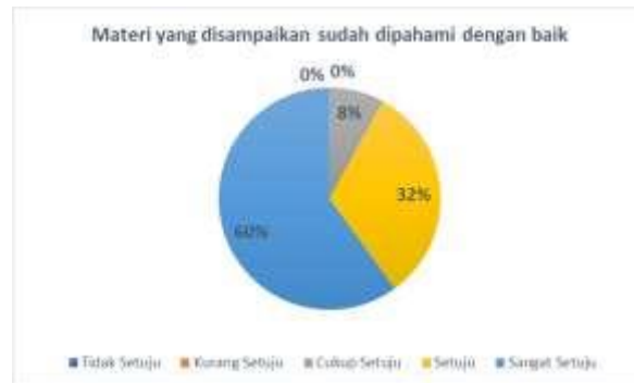
Gambar 4. Tanggapan Instrumen Kuesioner Pertama

Dari data tanggapan peserta PKM pada table 1 diatas bisa disimpulkan bahwa dari keseluruhan peserta yang memberikan tanggapan, ada sekitar 60% menjawab sangat setuju, 32% menjawab setuju dan 8% menjawab cukup setuju bahwa materi yang disampaikan sudah dipahami dengan baik oleh peserta pengabdian kepada Masyarakat. Data lengkapnya bisa dilihat pada pie diagram berikut ini: