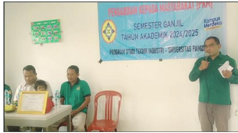
Gambar 1. Pengenalan Bahan Baku Berbasis Green Chemical