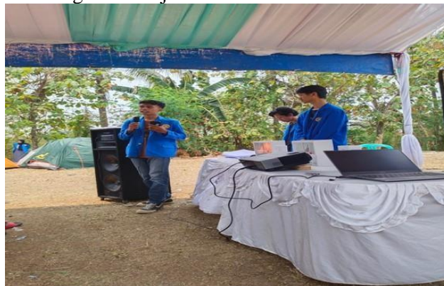
Gambar 1 Pemaparan Materi

Pembahasan dari hasil tersebut menunjukkan bahwa penyuluhan K3 di tingkat rumah tangga memiliki dampak positif yang dapat meningkatkan tingkat keselamatan dan kesehatan masyarakat. Namun, upaya berkelanjutan dalam pemeliharaan kesadaran dan peningkatan praktik K3 masih diperlukan untuk memastikan perubahan tersebut menjadi bagian integral dari kehidupan sehari-hari masyarakat Desa Pasir Gadung. Melibatkan masyarakat dalam proses evaluasi dan umpan balik juga akan mendukung keberlanjutan