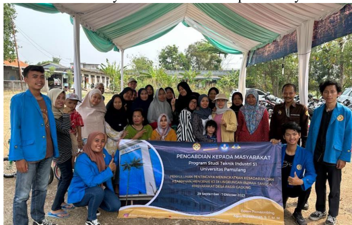
Gambar 4 Foto Bersama Masyarakat

Hasil dari pengabdian yang dilakukan kepada masyarakat desa Pasir Gadung, Kecamatan Cikupa, Kabupaten Tangerang pada tanggal 29 September - 1 Oktober 2023 dapat berjalan dengan aman dan lancar. Dengan mendatangi tiap rumah-rumah warga dan di bantu ketua RT untuk mengumumkan undangan kegiatan penyuluhan yang kami lakukan, telah dihadiri 30 orang warga berdasarkan lembar kehadiran. Dari 30 orang tersebut kami melakukan penilaian dari keaktifan warga saat proses penyuluhan telah didapatkan data yang kami tuangkan didalam diagram dapat dilihat pada Gambar 8.