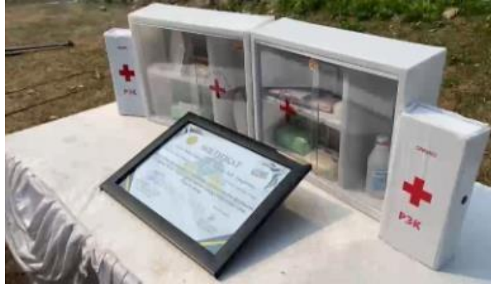
Gambar 2 Sertifikat dan Alat Kesehatan Kotak P3K