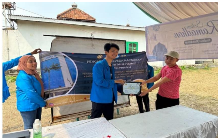
Gambar 3 Penyerahan Sertifikat Kepada Masyarakat.