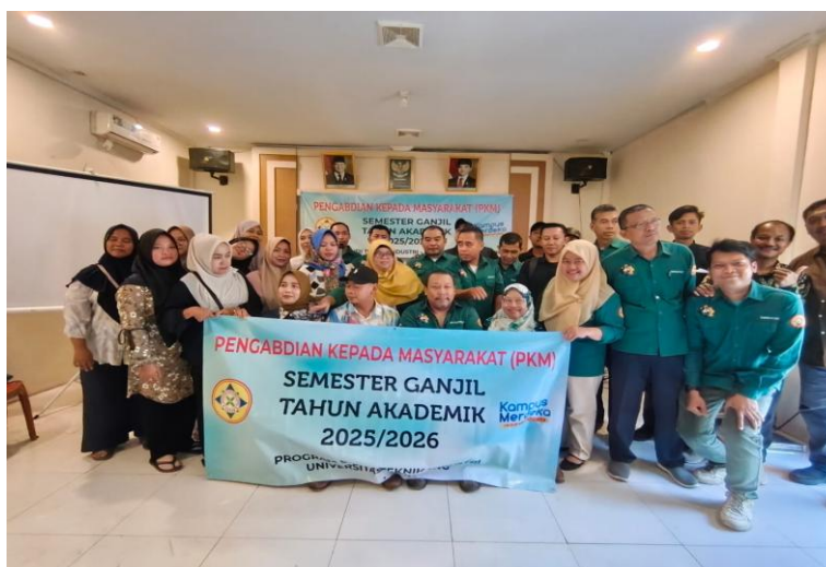
Gambar 5. Tim PKM Dosen bersama perangkat desa dan peserta.