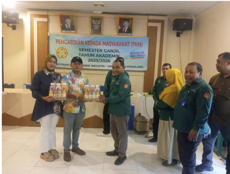
Gambar 6. Penyerahan Cenderamata PKM kepada Sekretaris Desa.