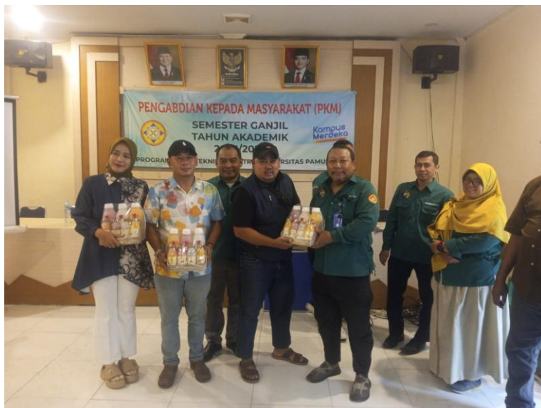
Gambar 7. Bersama peserta PKM