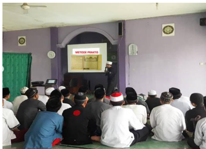
Gambar 2: Proses Pembelajaran Kitab Fathul Qarib

secara rinci. Sebelum mengakhiri pembelajaran kitab, ustadz akan memberikan kesempatan kepada santri untuk bertanya terkait pembahasan yang belum dipahami.