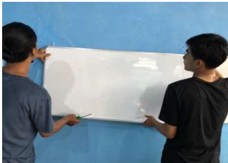
Gambar 1. Penyetelan posisi papan tulis

Pelaksanaannya dilakukan di ruang kelas TPQ Asshidiq. Kegiatan dilakukan dengan memperhatikan protokol kesehatan untuk mencegah penyebaran covid-19.