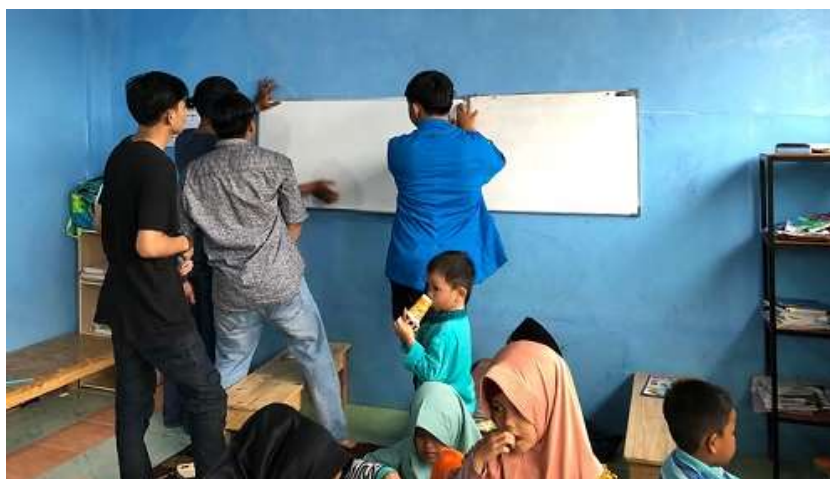
Gambar 3. Pemasangan papan tulis oleh Mahasiswa

Setelah acara dibuka dengan beberapa sambutan kemudian dilanjutkan dengan pemaparan materi dengan judul “Pembuatan Papan Tulis bahan melamin. Untuk TPQ Asshidiq di Desa Suradita Kecamatan Cisauk Kabupaten Tangerang”. Selanjutnya pemasangan papan tulis oleh mahasiswa.