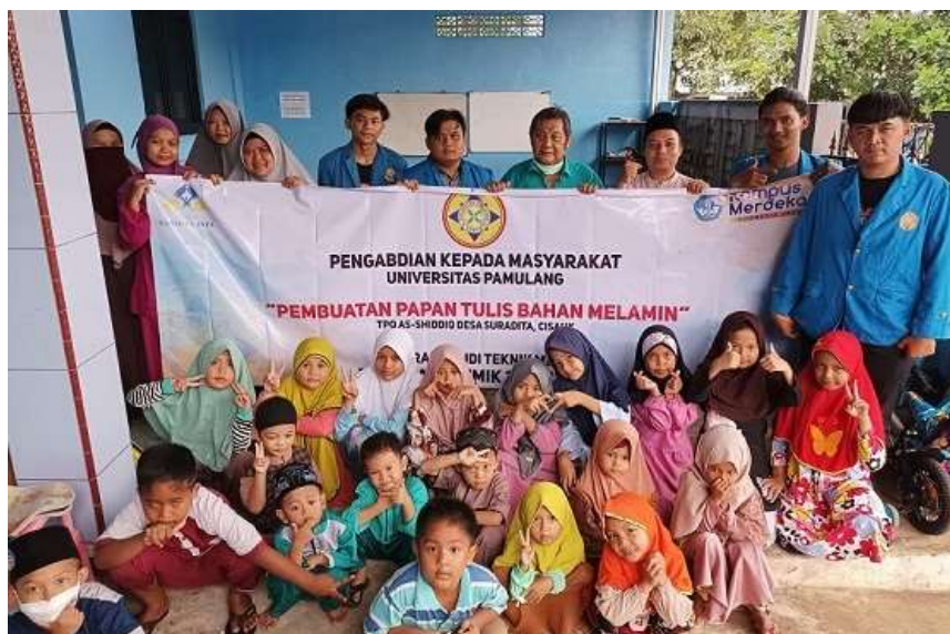
Gambar 4. Foto bersama siswa dan wali murid TPQ Asshidiq