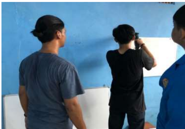
Gambar 2. Pemasangan papan tulis