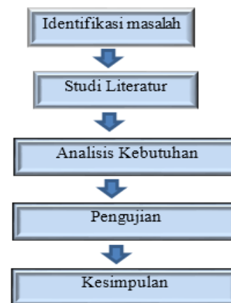
Gambar 1. Tahapan penelitian

Penelitian ini dilakukan dengan merancang alur penelitian. Alur penelitian ini dibuat untuk mempermudah dalam proses penyusunan laporan. Gambar 1 merupakan tahapan yang dilakukan pada penelitian: