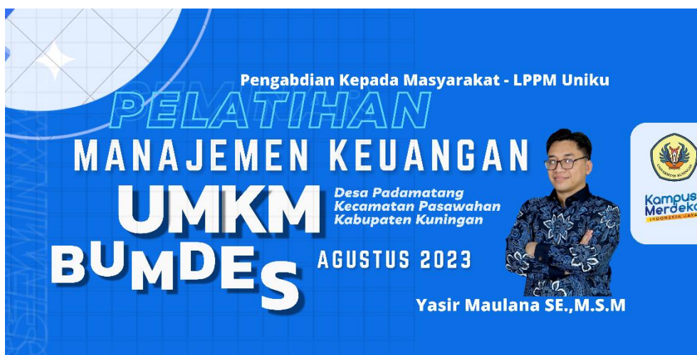
Gambar 1. Poster Kegiatan.

Permasalahan utama kelangsungan usaha dengan lemahnya pengetahuan dan ketrampilan UMKM konstruksi dapat diatasi dengan pelatihan pelatihan atau workshop. Tidak dengan model perkuliahan. Namun dengan model problem-based learning.