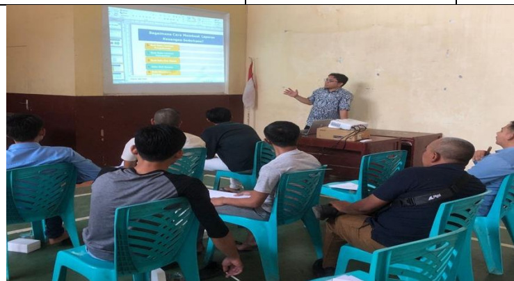
Gambar 2. Kegiatan pelatihan