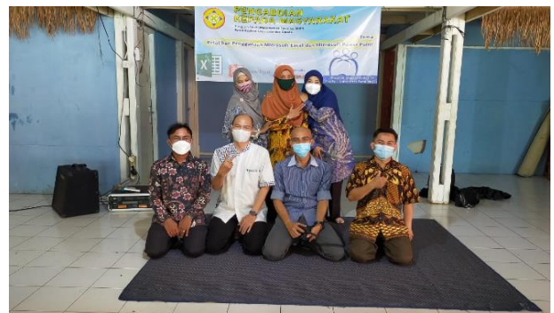
Gambar 3. Foto sesi Terakhir/ Penutupan Tim Pengabdian