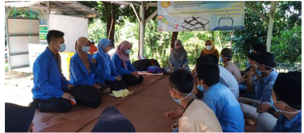
Gambar 2. Tim Pengabdian tengah menjelaskan proses pembuatan media pembelajaran matematika