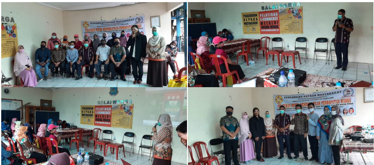
Gambar 2 : Foto bersama Kegiatan PkM

Sebaran kasus positif corona di Indonesia terus meluas. Sebanyak 414 kabupaten/kota di 34 provinsi sudah punya kasus Covid-19 Update Data Corona Dunia per 29 Mei 2020 yaitu Total angka infeksi virus corona (Covid-19) di dunia sudah hampir mencapai 6 juta kasus. Sementara episentrum utama pandemi Covid-19 menyebar di tiga regional, yakni Amerika, Eropa dan Asia. Berdasarkan data Worldometers, jumlah total kasus positif corona di dunia telah sebanyak 5.920.258 pasien. Data itu merupakan hasil update data terbaru 29 Mei 2020. Data yang sama menunjukkan angka kematian pasien Covid-19 di dunia ini mencapai 362.368 jiwa. Sementara 2.592.085 orang sudah dinyatakan sembuh dari Covid-19. Sebanyak 2.965.805 pasien positif corona masih menjalani perawatan dan isolasi. Dari 2,96 juta kasus aktif tersebut, sekitar 2 persen atau 53.966 pasien sedang dalam kondisi kritis. Negara-negara dalam daftar 10 besar pemilik kasus Covid-19 terbanyak di dunia masih belum banyak berubah. Amerika Serikat di peringkat pertama terus melaporkan kasus-kasus baru dengan jumlah signifikan.