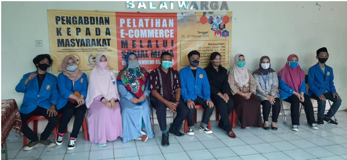
Gambar 1: Kegiatan PkM