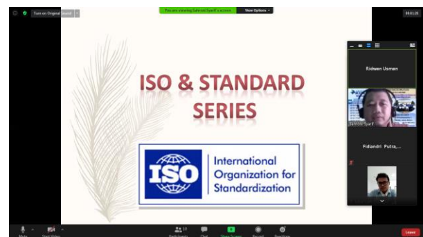
Gambar 1 : Pemberian Materi Awareness ISO 9001:2015

Pada sesi Tanya jawab ada beberapa pertanyaan mengenai tahapan proses sertifikasi dan berapa waktu yang dibutuhkan sampai dengan diperoleh sertifikasi, cara pembuatan SOP yang mudah, penyusunan bobot nilai risiko high, medium dan low. Kesemua pertanyaan tersebut sudah dijawab dengan baik.