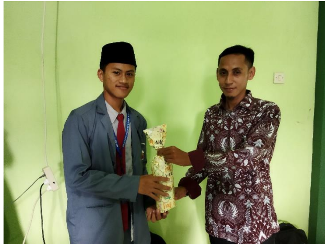
Gambar 4. Penyerahan hadiah salah satu pemenang kuis

Setelah materi semua disampaikan, dilanjutkan dengan kuis untuk para peserta, sebagai salah satu cara untuk menilai pemahaman para peserta. Peserta yang mampu menjawab pertanyaan mendapatkan hadiah.