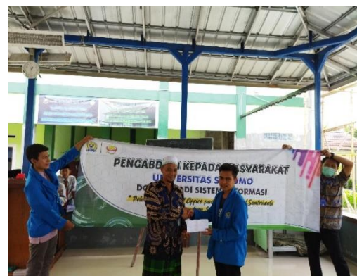
Gambar 6. Penyerahan donasi

Untuk mengukur tingkat pemahaman kami menggunakan pre-test dan post test . Berdasarkan gambar 9. menunjukkan adanya peningkatan pemahaman para santri sebelum adanya pelatihan dan setelah pelatihan. Pemahaman santri terhadap pengetahuan Microsoft Word sebelum disampaikan materi adalah 60,5 % terjadi peningkatan setelah adanya pelatihan yaitu mencapai 87,4%. Selanjutnya