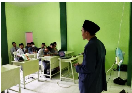
Gambar 1. Sambutan dari pihak Pesantren

Kegiatan Pengabdian kepada Masyarakat merupakan kegiatan yang dilakukan satu kali di setiap semesternya oleh Program Studi Sistem Informasi Universitas Sutomo. Hal ini sebagai bentuk pengaplikasian Tridharma perguruan tinggi, selain pengajaran dan penelitian perguruan tinggi berkewajiban melakukan Pengabdian kepada Masyarakat. Setelah melalui beberapa tahapan akhirnya dapat melaksanakan pelatihan Microsoft Office di Pondok Pesantren Subul El Salam yang dilaksanakan pada hari Sabtu tanggal 6 November 2021. Peserta pada pelatihan ini adalah siswa MA kelas 12, 10 santri perempuan dan 10 santri laki-laki.