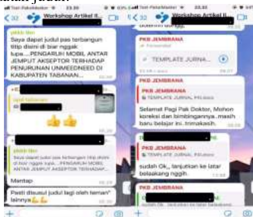
Gambar 4 Terlihat beberapa peserta yang memahami pemaparan materi dengan memulai pembuatan artikel ilmiah

Meskipun hanya mulai dengan judul, hal tersebut sudah baik untuk memulai pembuatan artikel ilmiah. Dapat diketahui bahwa hasil dari kegiatan ini bahwa keterampilan peserta mengenai artikel ilmiah meningkat yang dilihat dari mulai penulisan dengan pembuatan judul.