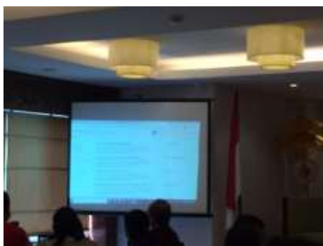
Gambar 2. Arahan kepada peserta untuk pencarian referensi pada Google Scholar

Setelah menemukan permasalahan, peserta diarahkan agar dapat menemukan jurnal terkait agar dapat dijadikan sebagai referensi dalam penulisan artikel ilmiah. Selain Google scholar , peserta dapat mencari referensi di e-book pada Google books . Narasumber memberikan bimbingan selagi melakukan pemaparan materi kepada peserta. Narasumber memberikan materi sistematika dalam penulisan artikel ilmiah agar peserta dapat memahami apa saja isi dari artikel ilmiah. Peserta juga dibimbing dan diajarkan bagaimana rumus ataupun tata cara dalam penulisan bagian-bagian dalam artikel ilmiah.