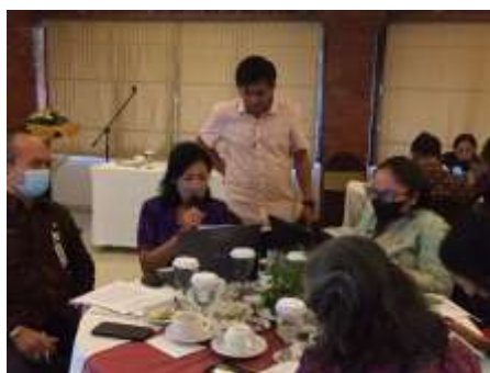
Gambar 1. Narasumber memberi kesempatan kepada peserta untuk mengetahui isi abstrak

menemukan jurnal terkait agar dapat dijadikan sebagai referensi dalam penulisan artikel ilmiah. Selain Google scholar , peserta dapat mencari referensi di e-book pada Google books . Narasumber memberikan bimbingan selagi melakukan pemaparan materi kepada peserta. Narasumber memberikan materi sistematika dalam penulisan artikel ilmiah agar peserta dapat memahami apa saja isi dari artikel ilmiah. Peserta juga dibimbing dan diajarkan bagaimana rumus ataupun tata cara dalam penulisan bagian-bagian dalam artikel ilmiah.