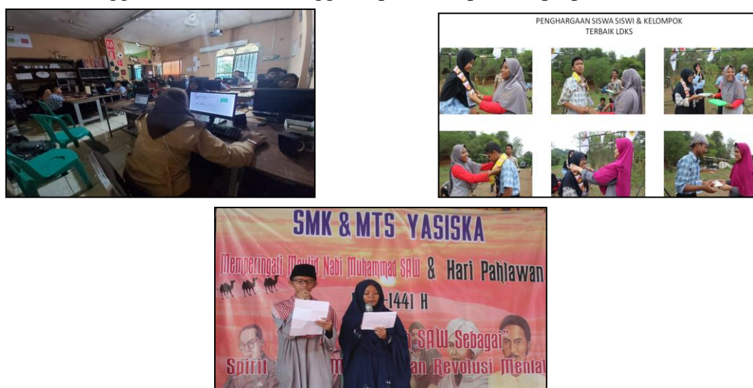
Gambar 1. Kegiatan belajar dan mengajar di Yayasan Iskandariyah

Yayasan Pendidikan Islam Iskandariyah mempunyai satuan unit pendidikan Islam, mulai dari TK, hingga SMK. Tenaga pendidik di Yayasan Iskandariyah perlu diberikan peningkatan pengetahuan, keterampilan dan karakter untuk semua tenaga pendidik. Selama ini, permasalahan yang timbul dalam Yayasan Iskandariyah adalah, Pertama, banyaknya guru yang belum menyesuaikan diri dengan perkembangan jaman. Kedua, Adanya guru yang belum menggunakan alat-alat canggih seperti komputer, laptop, infokus serta alat