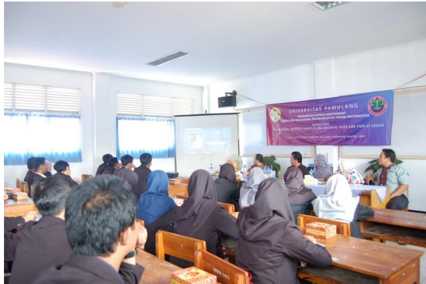
Gambar 2. Sosialisasi