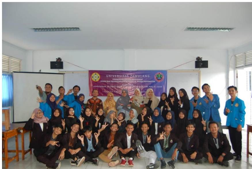
Gambar 3. Tim PKM dosen, mahasiswa dan siswa

Berbagai pertanyaan disampaikan kepada kami dari peserta setelah mereka mengikuti pemaparan materi sosialisasi, diantaranya: bagaimana cara memilah konten yang hanya diperlukan pelajar? bagaimana cara mengatasi / memulihkan data yang dirusak oleh pihak-pihak yang tidak bertanggung jawab? Bagaimana cara bersosial media yang bijak? Dan banyak lagi pertanyaan yang disampaikan, sungguh respon yang luar biasa.