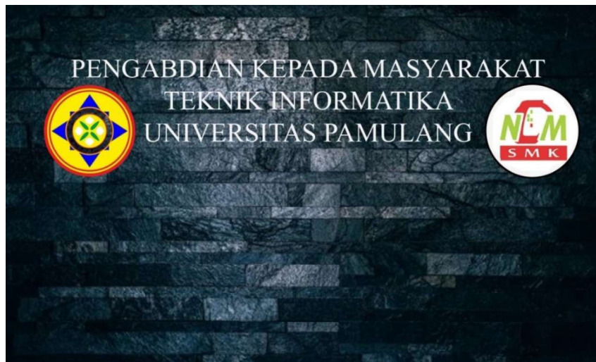
Gambar 4. Tampilan Poster Online PKM untuk peserta dan masyarakat umum

Aplikasi Google Classroom digunakan untuk tujuan pendidikan agar lebih mudah dipahami. Dengan cara ini, pengguna Google Classroom bertindak seperti guru, mengelola pembelajaran dan