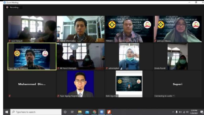
Gambar 2. Tampilan visualisasi menggunakan media conference call Zoom