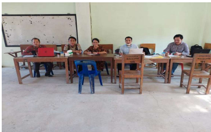
Gambar. 1. Panitia PKKMB

Kegiatan ekstrakurikuler yang beragam ini diharapkan dapat meningkatkan kemampuan siswa dalam memecahkan masalah kehidupan nyata yang dihadapi masyarakatnya. Kampus Mandiri menginspirasi kita untuk menjadi pembelajar seumur hidup yang tangguh, tangguh dan tangguh di era Revolusi Industri, terus belajar, menemukan bakat dan minat kita, dan memajukan keterampilan kita. Pendidikan adalah kunci untuk memecahkan krisis pembelajaran dan banyak tantangan yang dihadapi negara kita. Siswa terdaftar di nasional (Laya, B., Laya, R.D., Zai, E. darah; siap, saya; Ji, Yu; Harpa, D; Ndru, 2021). Pengenalan Kehidupan Mahasiswa Baru (PKKMB) dapat menjadi sarana penting untuk mengubah paradigma mahasiswa baru dari 'mahasiswa' menjadi 'mahasiswa'. Anda belajar bagaimana bekerja atau bekerja di berbagai bidang, bukan hanya seorang ilmuwan untuk bekerja, dan bagaimana menjadi berguna dan berkontribusi pada masyarakat. ini Kampus Merdeka!.