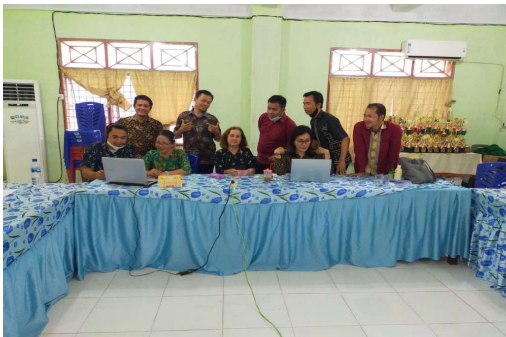
Gambar. 4 Panitia setelah selesai Kegiatan PKKMB