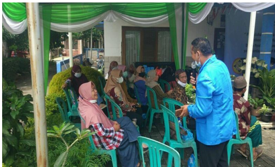
Gambar 3. Diskusi dan tanya jawab dengan peserta