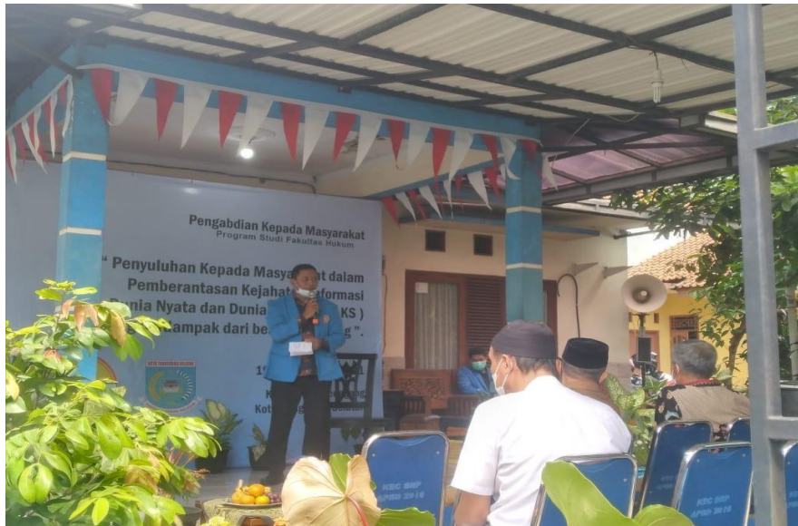
Gambar 2. Pemaparan materi sosialisasi PKM kepada peserta