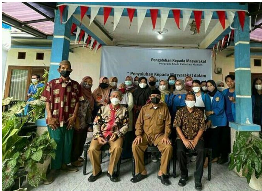
Gambar 5. Foto bersama Lurah Cilenggang dan peserta kegiatan