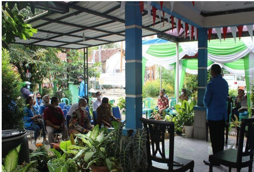
Gambar 1. Perkenalan dan penjelasan tujuan kunjungan PKM

Berikut beberapa foto dokumentasi kegiatan PKM ini: