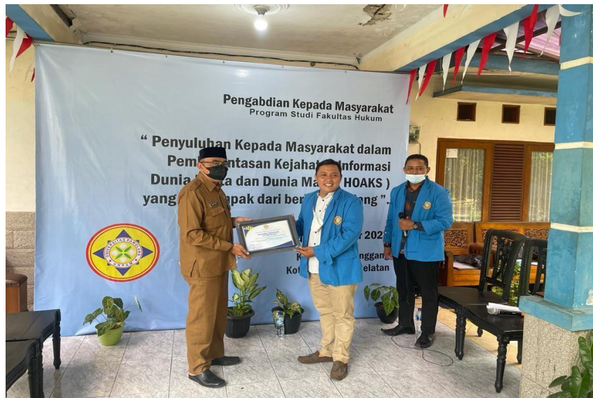
Gambar 4. Penyerahan piagam penghargaan