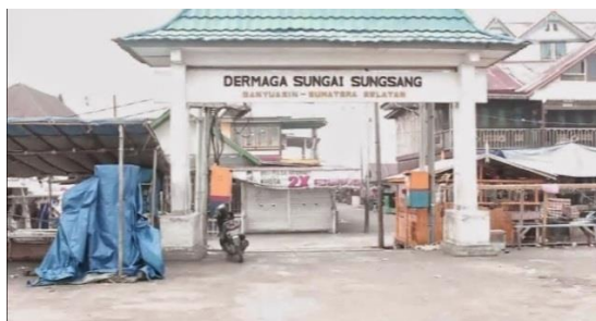
Gambar 1. Dermaga Sungai

Hal penting dalam pembuatan perdes ini menjadi hal penting bagi Desa Sungsang Kabupaten Banyuwangi ini. Dalam perjalanannya hierarki aturan perundang-undangan diatur dalam Undang-Undang Nomor 12 Tahun 2011 tentang peraturan perundangan yang pelaksanaan dari perintah Pasal 22A Undang-Undang Dasar Negara Republik Indonesia Tahun 1945.