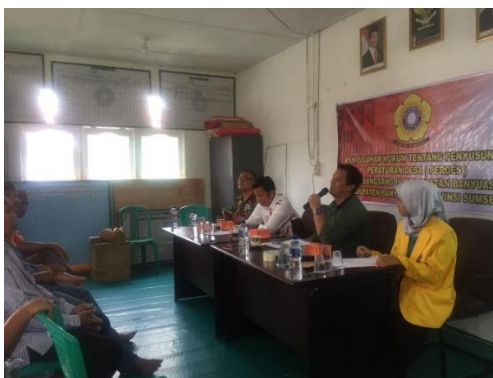
Gambar 4. Pelaksanaan Kegiatan Penyuluhan di Desa Sungsang, Kabupaten Banyuasin, Sumatera Selatan

Dalam konteks itu, terdapat keberhasilan implementasi Undang-Undang tentang Desa mensyaratkan adanya pemahaman yang sama dan keahlian khusus di kalangan para penyelenggara pemerintahan desa dan masyarakat desa mengenai pembentukan Peraturan Desa sesuai dengan kaidah hukum dan teknik baku pembentukan peraturan perundang-undangan sebagaimana telah diatur oleh Undang-Undang Nomor 12 Tahun 2011 tentang Pembentukan Peraturan Perundang-Undangan. Undang-Undang tentang Desa tidak merinci lebih lanjut tentang teknik pembentukan Peraturan Desa, oleh karena itu melalui pedoman pembentukannya harus mengacu pada Undang-Undang tentang Pembentukan Peraturan Perundang-Undangan yang telah mengatur cara dan metode yang pasti, baku dan standar dalam pembentukan peraturan perundang-undangan mulai dari tahapan perencanaan, penyusunan, pembahasan, pengesahan atau penetapan, dan pengundangan. Dengan demikian, perlu adanya tertib hukum dan harmonisasi hukum nasional sehingga dapat selalu terjaga dengan baik. nasional sehingga dapat selalu terjaga dengan baik.