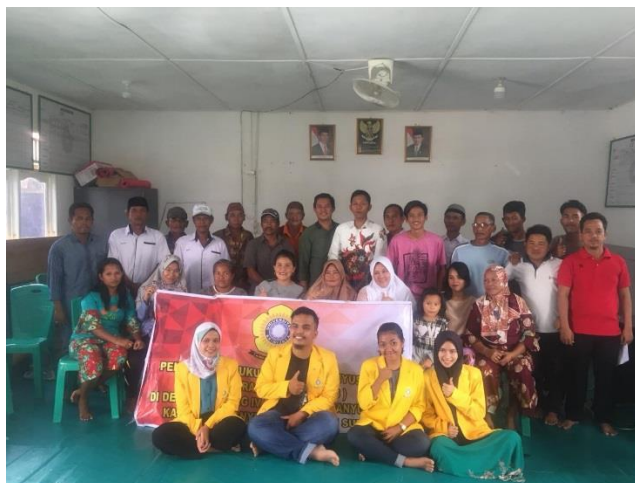
Gambar 4. Foto Bersama Setelah Pelaksanaan Kegiatan Penyuluhan)

Dan semoga dengan adanya penyuluhan hukum tentang pembentukan Peraturan Desa ini dapat membuka cakrawala masyarakat desa. Disamping itu dapat mempermudah Kepada Desa, Anggota BPD dan masyarakat dalam penyusunan perdes itu sendiri.