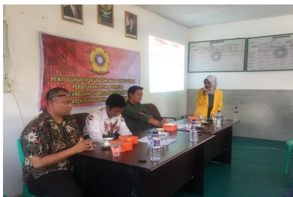
Gambar 3 : Pembukaan Kegiatan Penyuluhan Pembuatan Peraturan Desa Di Desa Sungsang, Kabupaten Banyuasin, Sumatera Selatan

Kegiatan penyuluhan ini dilaksanakan dengan baik dan lancar. Warga masyarakat yang mengikuti kegiatan penyuluhan ini mengikuti dengan seksama semua penjelasan yang diberikan oleh tim penyuluh. Disamping itu para peneliti juga menjelaskan dengan detail dimulai dari sejarah Undang-Undang Tentang Desa ini.