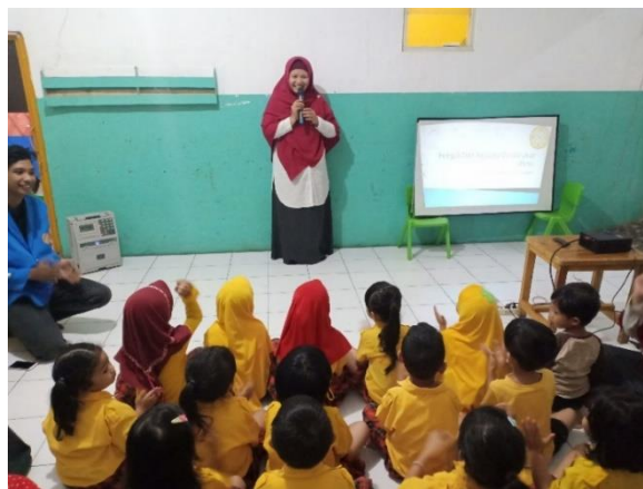
Gambar 1. Penerapan Aplikasi Panduan Sholat 1a-3i

Pada hasil pelaksanaan pengabdian diperoleh bahwa keberhasilan kegiatan sosialisasi aplikasi panduan sholat wajib dan sunah hamper 100% bias diterapkan lihat pada tabel 1, dimana setiap menu dapat diakses dengan baik serta dapat dicoba pada device guru pengajar TK Alpabeta karena anak belum diperkenankan untuk menggunakan device sendiri . Berikut ini foto dari kegiatan yang menjadi acuan hasil kegiatan yang berlanca lancer.