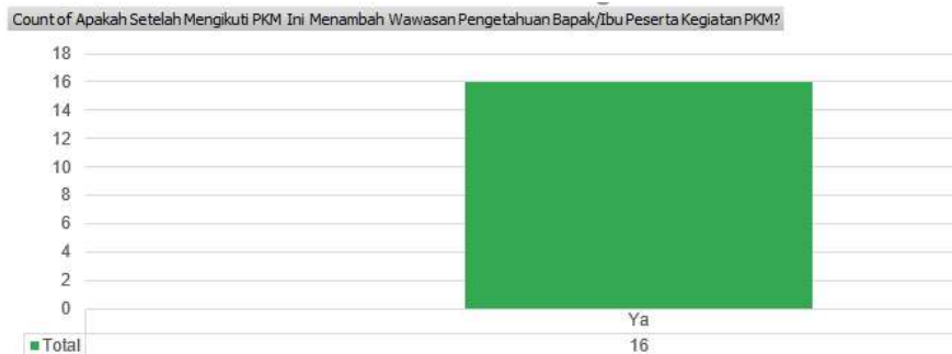
Gambar 2 Hasil Survei terhadap Pertanyaan 2

Dari pertanyaan yang diberikan, hasil yang di dapatkan dari 16 peserta, menjawab sangat baik sebanyak 8 peserta dan menjawab baik sebanyak 8 peserta untuk pertanyaan 1.