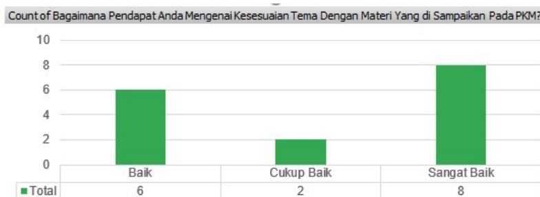
Gambar 3 Hasil Survei terhadap Pertanyaan 3

Dari pertanyaan yang diberikan, hasil yang di dapatkan dari 16 peserta, menjawab ya sebanyak 16 peserta untuk pertanyaan 2.