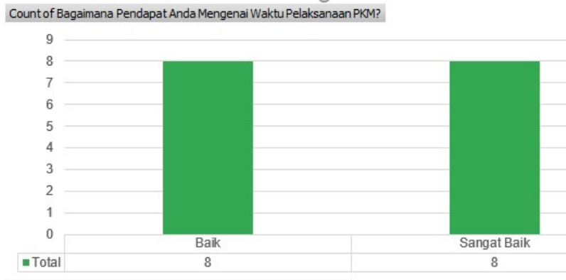
Gambar 1 Hasil Survei terhadap Pertanyaan 1

Secara detail hasil jawaban survei sebagai berikut :