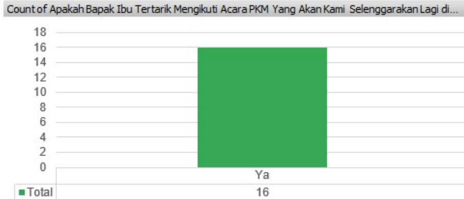
Gambar 6 Hasil Survei terhadap Pertanyaan 6

Dari pertanyaan yang diberikan, hasil yang di dapatkan dari 16 peserta, menjawab ya sebanyak 16 peserta untuk pertanyaan 6.