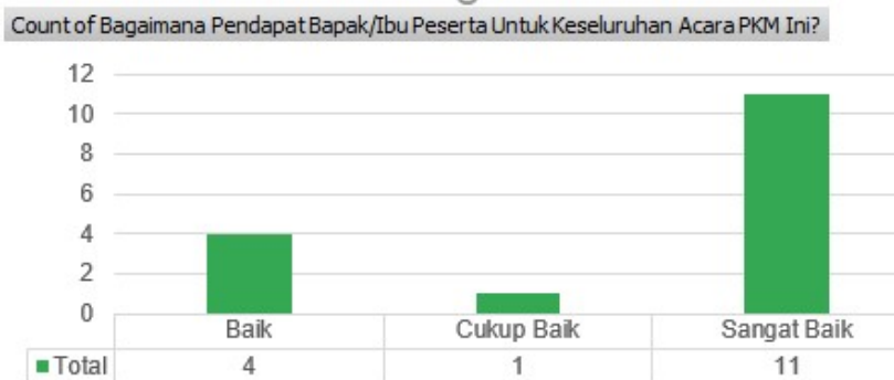
Gambar 5 Hasil Survei terhadap Pertanyaan 5

Dari pertanyaan yang diberikan, hasil yang di dapatkan dari 16 peserta, menjawab sangat bermanfaat sebanyak 10 peserta dan menjawab bermanfaat sebanyak 6 peserta untuk pertanyaan 4.