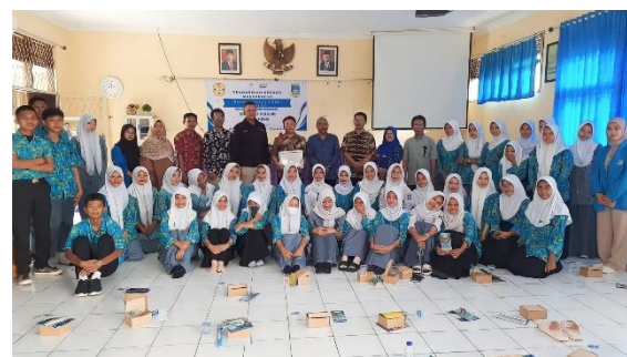
(Gambar 2. Foto Bersama dengan siswa siswi SMA Negeri 1 Petir pada saat PKM )