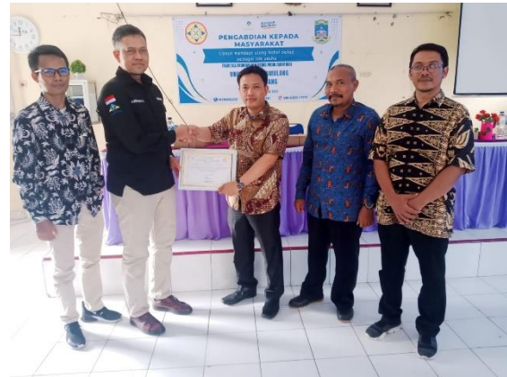
(Gambar 1. Foto Penyerahan sertifikat PKM kepada Kepala Sekolah SMA Negeri 1 Petir )

sampah yang belum bisa diolah menjadi kerajinan tangan yang bernilai pasar tinggi