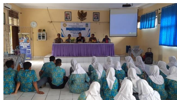
(Gambar 3. Foto Bersama dengan siswa siswi SMA Negeri 1 Petir pada saat