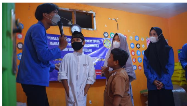
Gambar 2. Sesi tanya jawab dengan audience