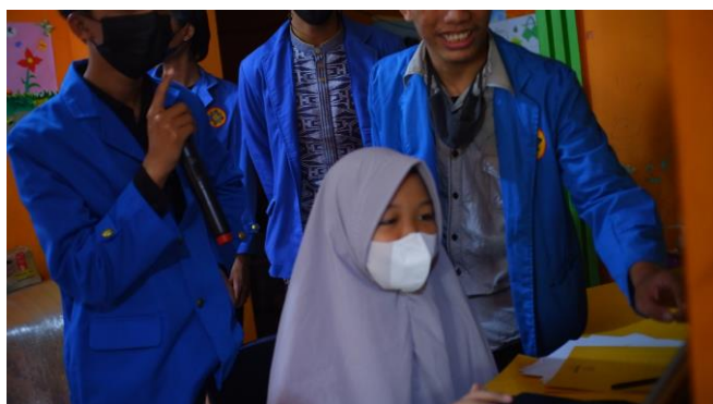
Gambar 3. Pengenalan dan praktek office pada audience