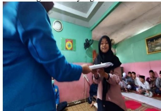
Gambar 3. 8 Pembagian Doorprize kepada santriwati

Kemudian kegiatan pkm dilanjutkan oleh Ahmad Syafrudin yang memberikan materi tentang pengenalan Microsoft Office. Dilanjutkan dengan penyampaian materi tentang Microsoft Excel oleh Muhammad Yusuf Virasdi.