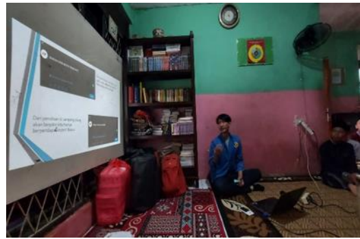
Gambar 3. 7 Pemaparan Materi Etika Berinternet