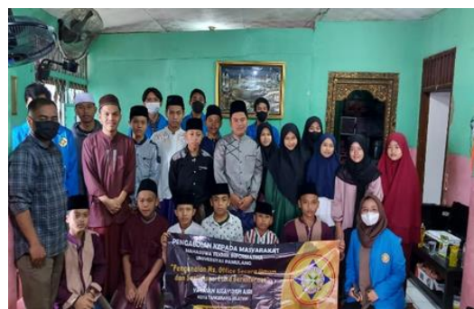
Gambar 3. 9 Foto Bersama Para Santri dan Santriwati