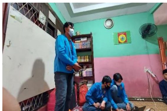
Gambar 3. 2 Sambutan Ketua Pelaksana