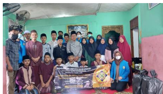
Gambar 3. 10 Foto Bersama para Santri dan Santriwati