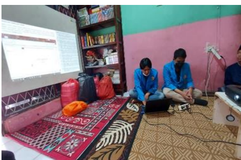
Gambar 3. 6 Pemaparan Materi Microsoft Power Point