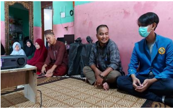
Gambar 3. 3 Sambutan Dosen Pembimbing